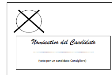
Esempio di voto alla lista con la preferenza